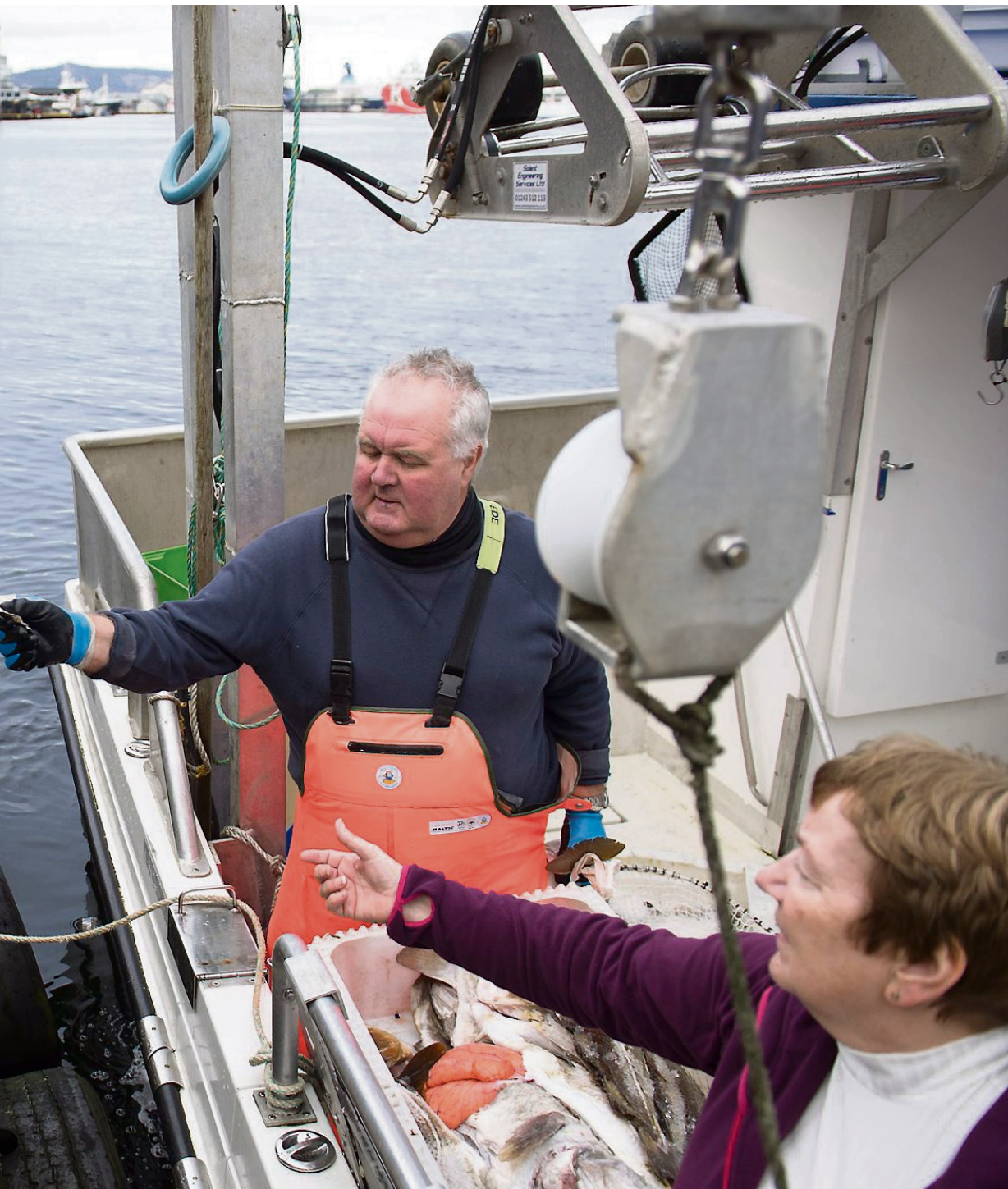
i sitt slag på femti år. Fiskesalget har imidlertid ikke blitt den suksessen flere hadde håpet på. Fondenes tror det dels