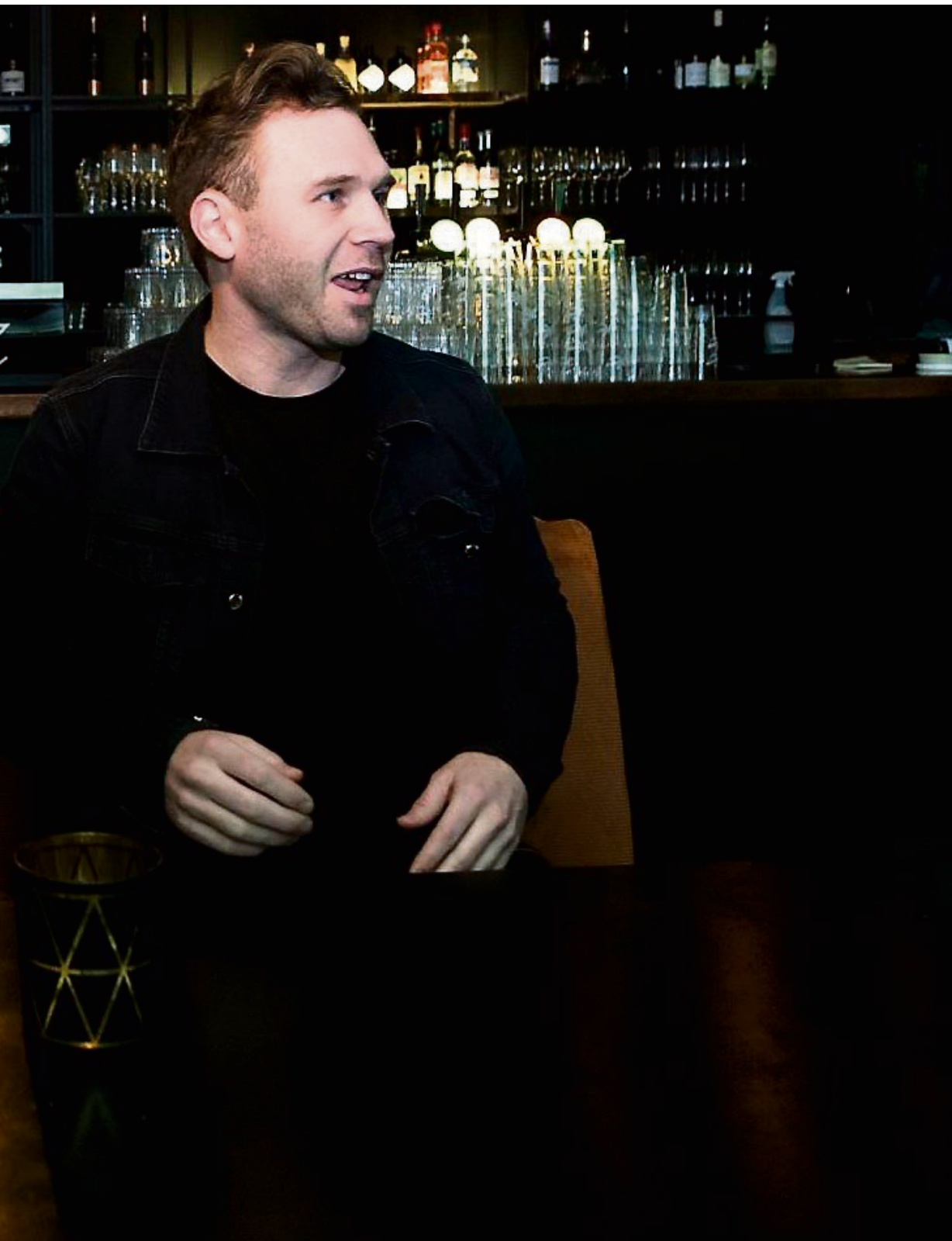
velkommen fredag. Nå til et helt nytt matkonsept.