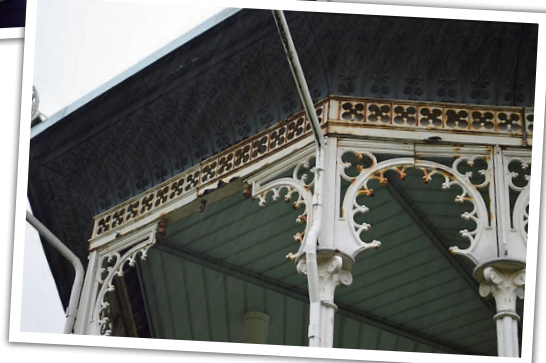
FØRSTEPRI: Når platen er på plass, skal paviljongen vaskes ned - og så går en løs på all rusten. Og oppunder taket innvendig skal det og skrapes og males etter alle kunstens regler.