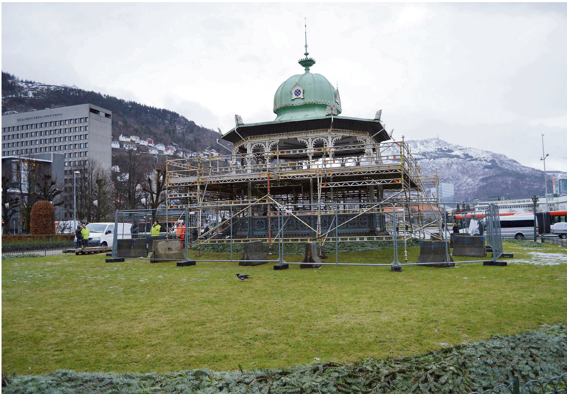
SNART I GANG: Like over helgen blir Musikkpaviljongen «pakket inn», og når den neste gang blir å se skal den være totalrenoveret.