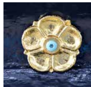
ROSETTER: På taklistene er det rundt 120 små rosetter. De er alle tatt ned og pusset, før de er malt med bladgull.