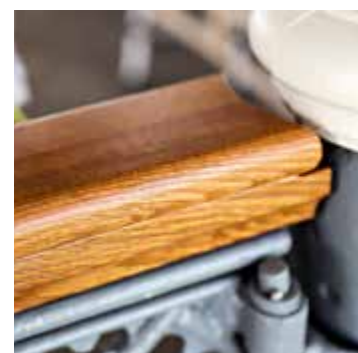
NYTT: Råtne deler som armgangene på rekkverket, er erstattet med nye tro kopier.