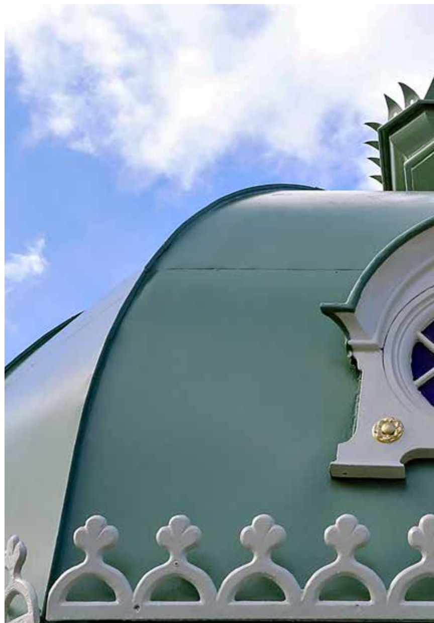
KUPPELEN SKINNER: Kuppelen på Musikkpaviljongen skinner etter oppussingen.

I dag fjernes plast og stillaser rundt Musikkpaviljongen. Byens lille perle kan igjen skinne.