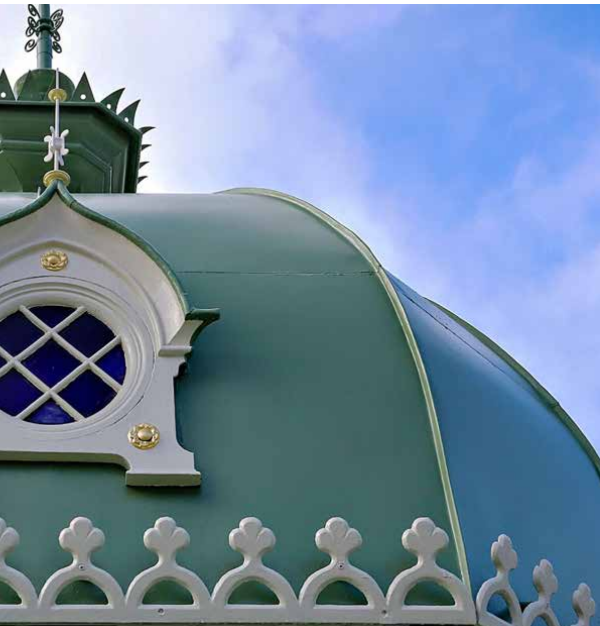
Legg merke til de vakre vinduene.