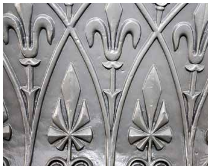
PUSSET OG MALT: Noen deler er pusset og malt på stedet.

Iversen trengte spesialisthjelp, stilte de opp og gjorde jobben gratis. Resultatet kan folk selv se når plasten og stillaser er borte. Vi kan love at du ikke blir skuffet.