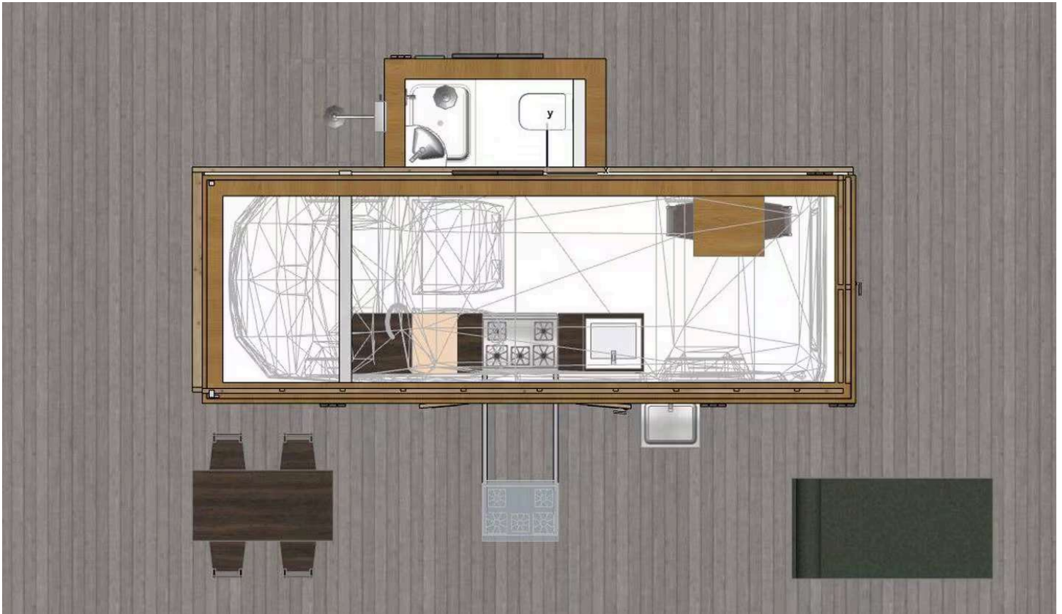
Slik ser de foreløpige tegningene ut.